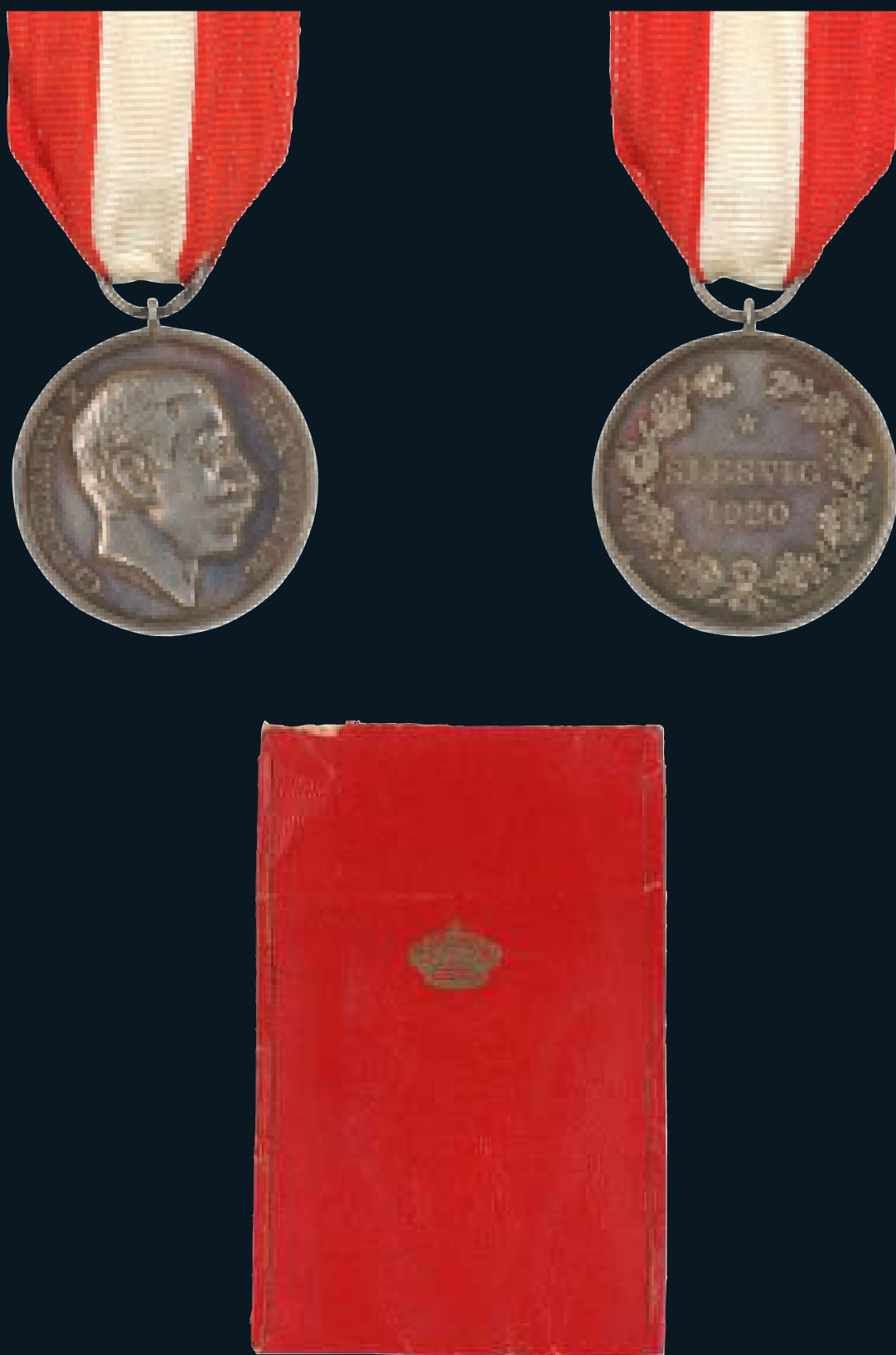
■ Ill. 2/3 Médaille commémorative du Slesvig de 1920, avers et revers, avec sa pochette rouge. Coll. JRW