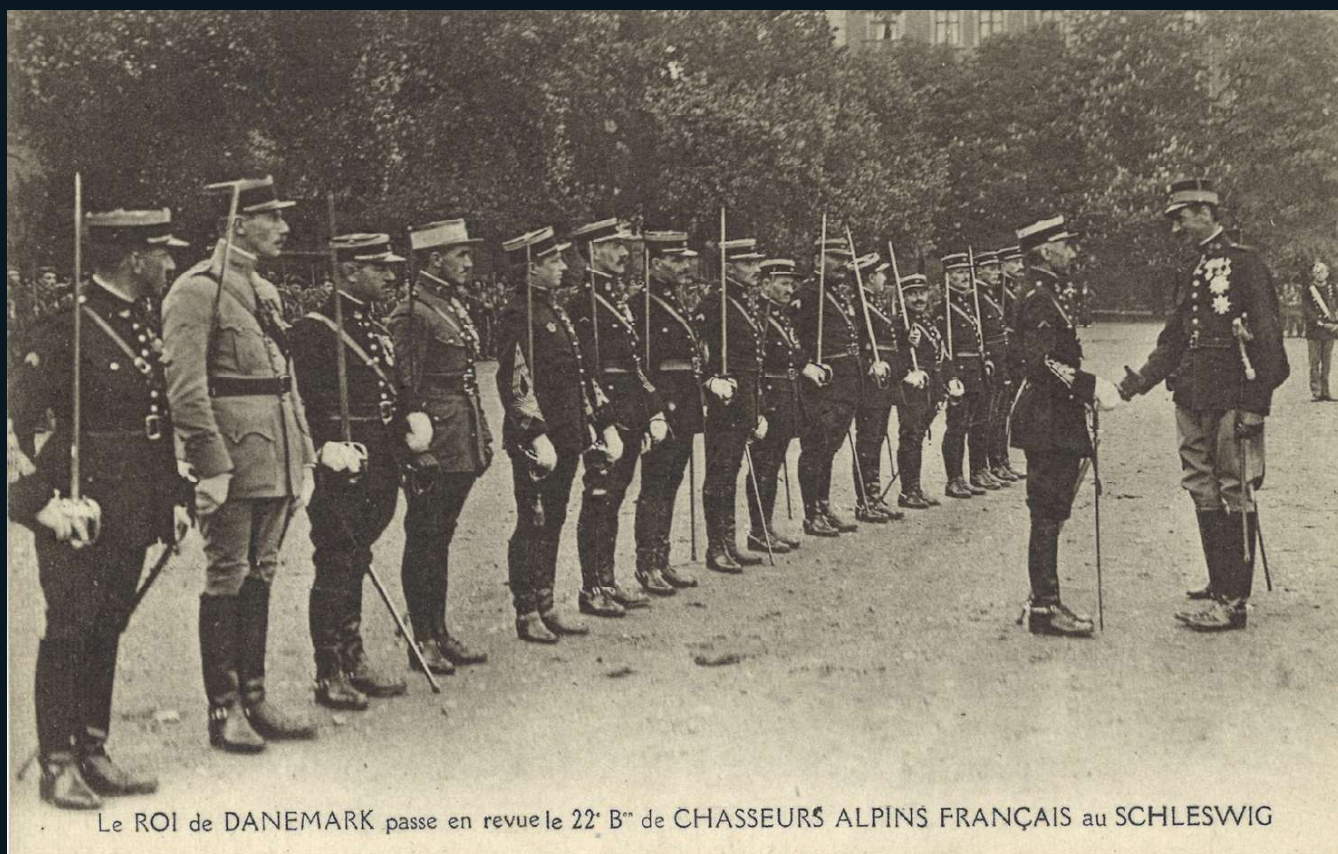
Le ROI de DANEMARK passe en revue le 22 e B n de CHASSEURS ALPINS FRANÇAIS au SCHLESWIG