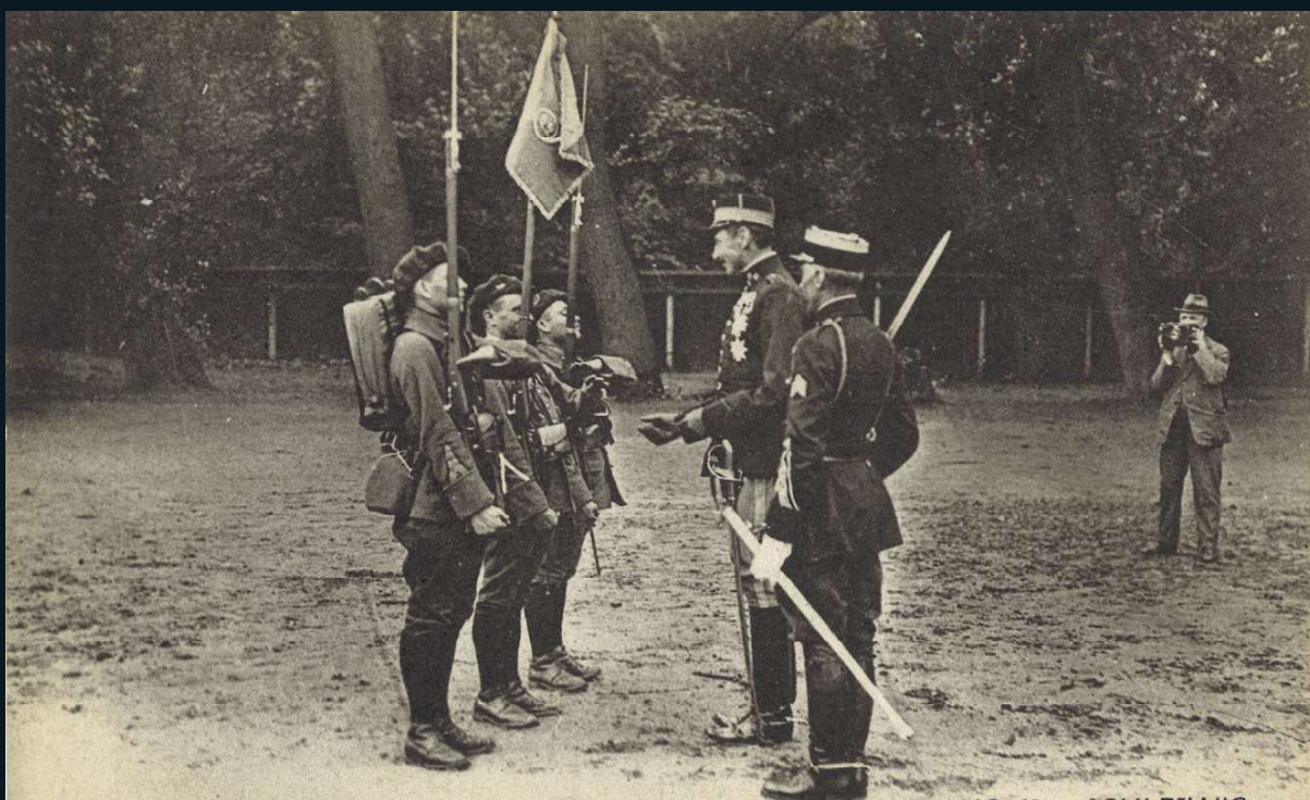
Le ROI de DANEMARK passe en revue le 22 e B n de CHASSEURS ALPINS FRANÇAIS au SCHLESWIG