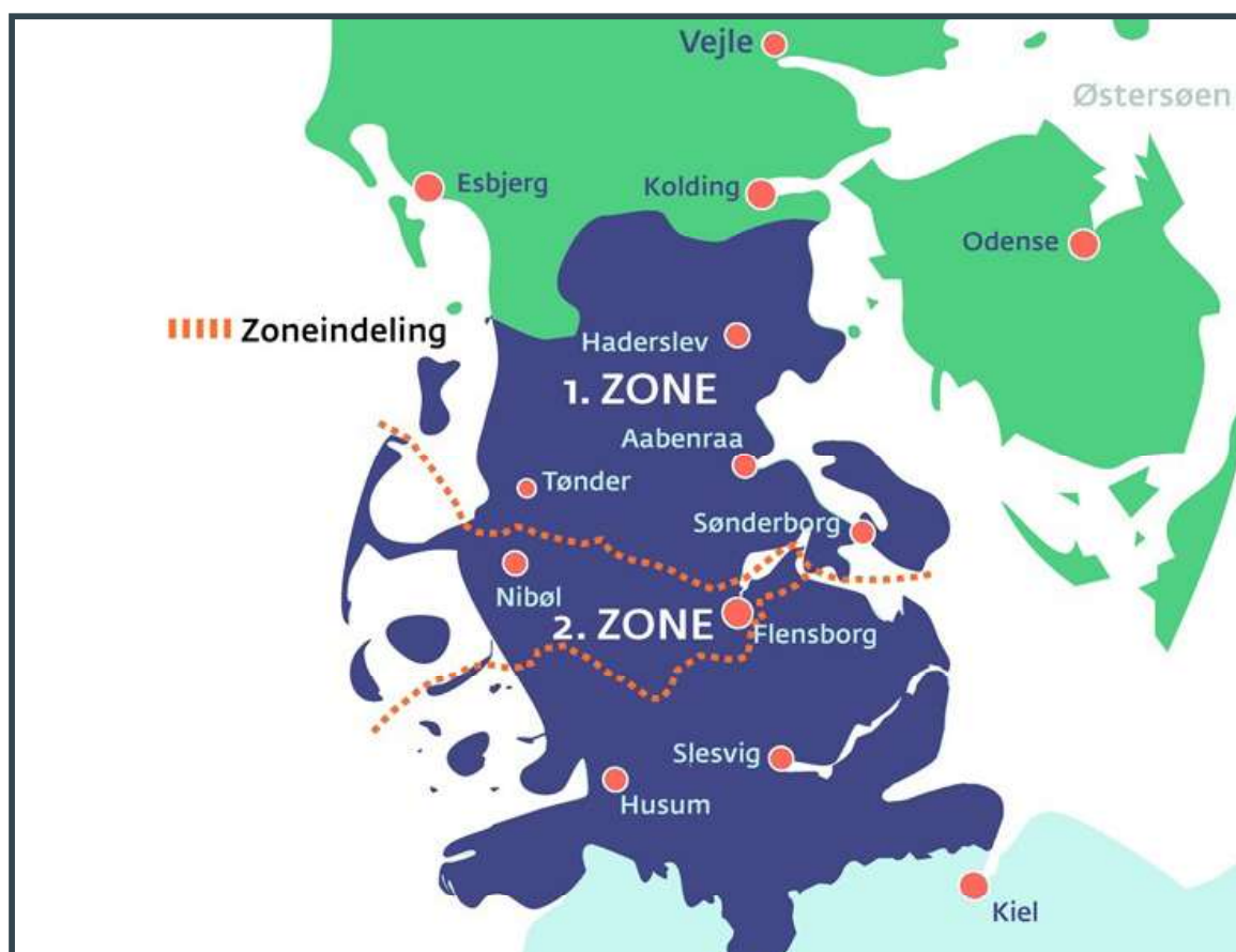
■ Ill. 1 Carte de l'ancien duché de Slesvig

En vue de déterminer la future frontière dano-allemande après la conclusion du traité de Versailles le 28 juin 1919, deux plébiscites furent organisés en deux zones dans l'ancien duché de Slesvig conquis par la Prusse et l'Autriche dans la guerre de 1864 contre le Danemark. Le processus fut supervisé par la Commission internationale de Surveillance du Plébiscite Slesvig (CIS) composée de représentants de la France 2 , du Royaume-Uni, de la Norvège et de la Suède. Les plébiscites eurent lieu sous la surveillance des troupes françaises 3 et britanniques le 10 février (zone I, Slesvig du Nord, à majorité danoise) et le 14 mars 1920 (zone II, Slesvig central, à majorité allemande).