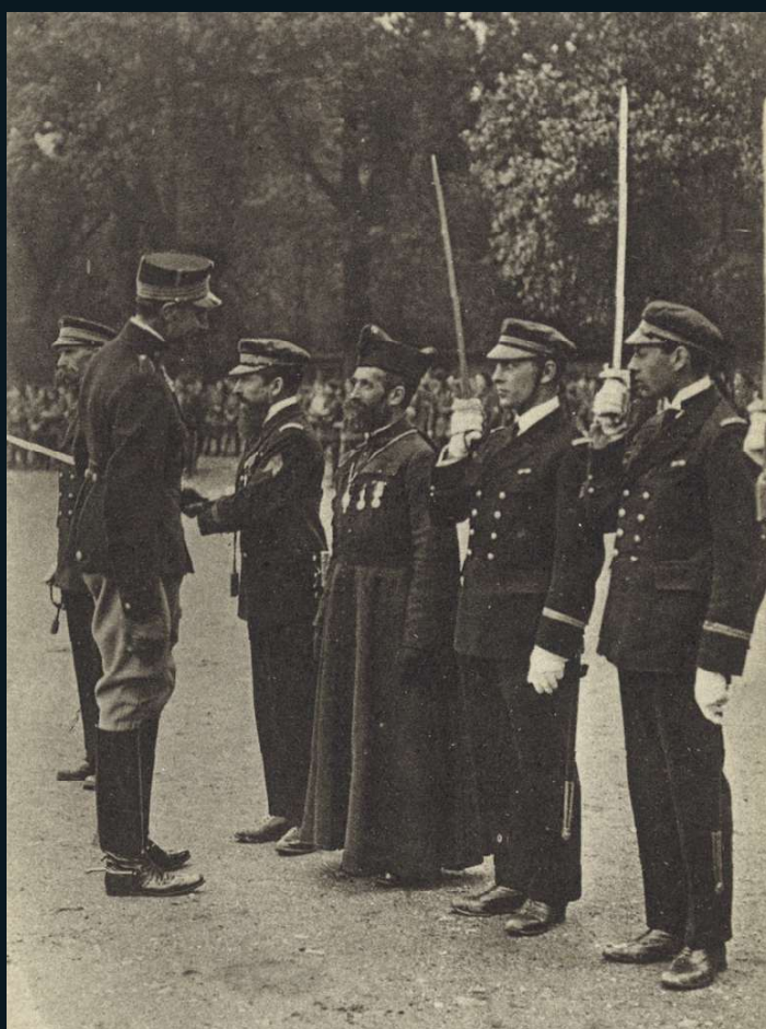
Le ROI de DANEMARK passe en revue le 22 e B n de CHASSEURS ALPINS FRANÇAIS au SCHLESWIG