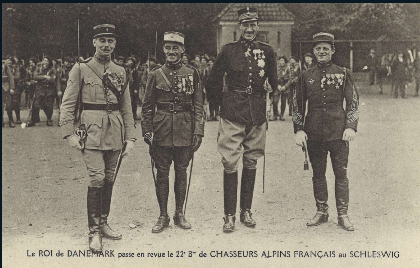
Le ROI de DANEMARK passe en revue le 22 e B n de CHASSEURS ALPINS FRANÇAIS au SCHLESWIG